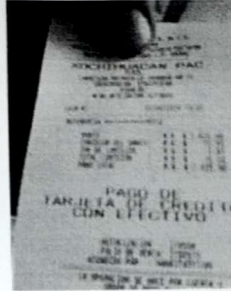
WhatsApp Image 2024-10-18 at 5.19.57 PM.jpeg